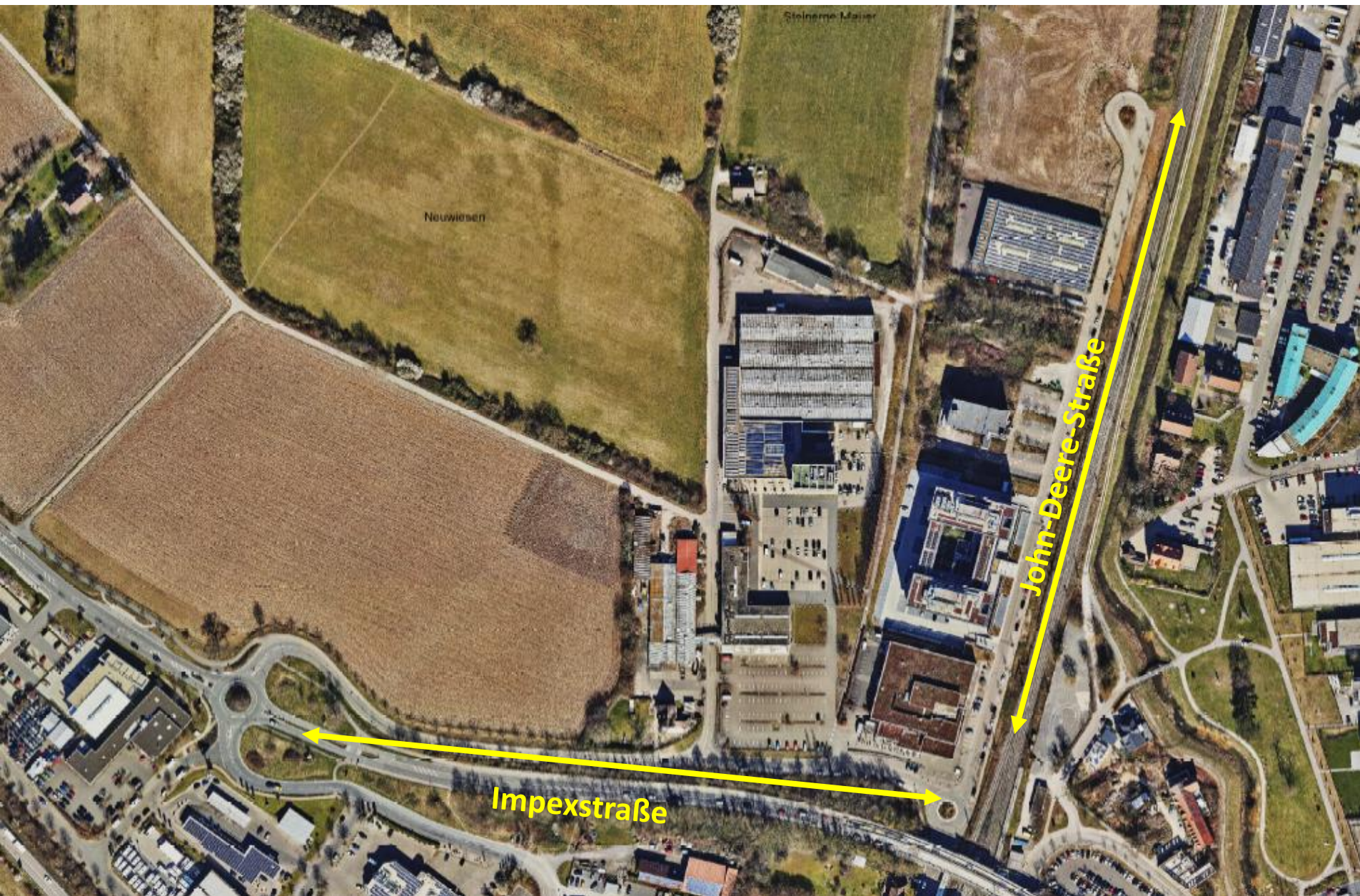
Luftbild mit geplanter Benennung

Umbenennung Impexstraße in John-Deere-Straße