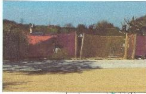
Platz für Fußball umlauf mit Netzen