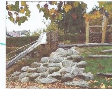
Kletterfelsen und Aussichtspunkt