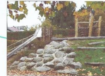
Kletterfeilen und Aussichtspunkt