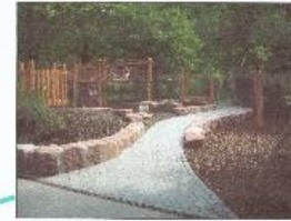
Rundkurs und Verbindung