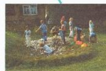
Wilde Ecke mit Baumaterial