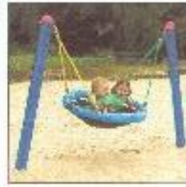
Nestschaukel für Kleine

Einfriedung U3-Bereich Einbezug geneigte Fläche