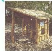
Verkaufsstelle für Sandkuchen