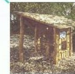
Verkaufsstelle für Sandkuchen