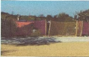
Fläche für Fußball Ballfang mit Netzen