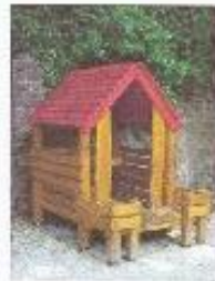
Häuschen für Rückzug / Rollenspiele