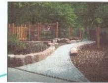
Rundkurs und Verbindung