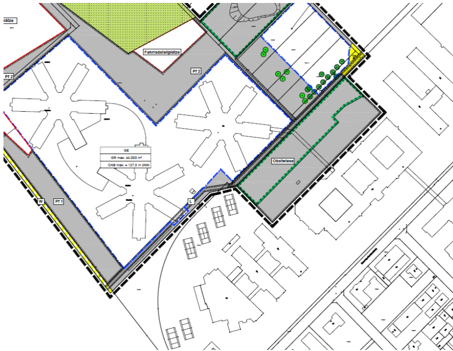
Abb.: Ausschnitt Bebauungsplan „Walzrute, 2. Änderung“

Nördlich grenzt der Bebauungsplan „Westlich der Neurottstraße II, 1. Änderung“ aus dem Jahr 1990 (1. Änderung -Vergnügungsstättenkonzeption- aus dem Jahr 2011) an, der das SAP-Hauptgebäude (WDF 01) zum Inhalt hat. Der vorliegende Bebauungsplan überlagert dessen Geltungsbereich in einem schmalen ca. 5,3 m breiten Streifen entlang der südwestlichen Geltungsbereichsgrenze. Das SAP-Schulungs- und Bürogebäude überschreitet die ursprünglich festgesetzten Baugrenzen im Norden um ca. 6 m und überragt auch die ursprüngliche Geltungsbereichsgrenze knapp. Vor dem Hintergrund, das bestehende SAP-Schulungs-/Bürogebäude vollständig in den neuen Geltungsbereich aufzunehmen, wurde der Bereich in das Aufstellungsverfahren einbezogen.